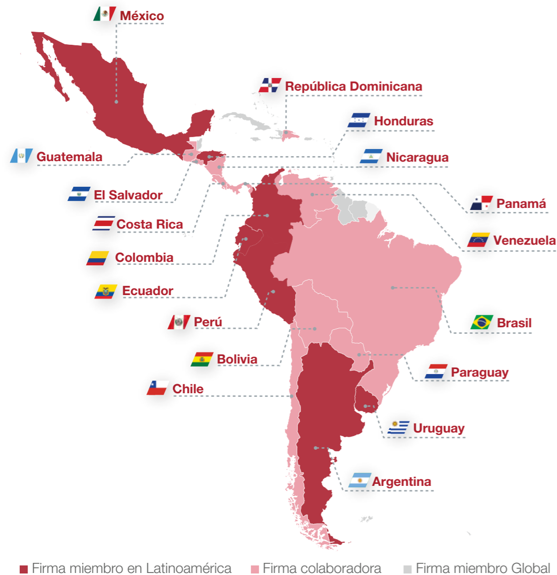
Firmas Miembro y Colaboradoras de Andersen en la región

Andersen tiene presencia en América Latina a través de las firmas miembro y firmas colaboradoras de Andersen Global.